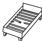
Bettgestell 3-4 Marken